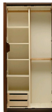
ブレザータンス(02E) W886・H2016・D560 ¥515,000+税