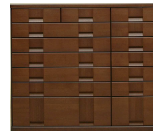
ワイド整理タンス(03W) W1607・H1379・D560 ¥804,000+税