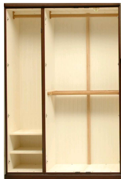
洋服タンス(02B) W1322・H2016・D560 ¥695,000+税