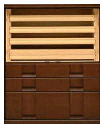
ハイ和タンス(01A) W1082・H1379・D560 ¥494,000+税