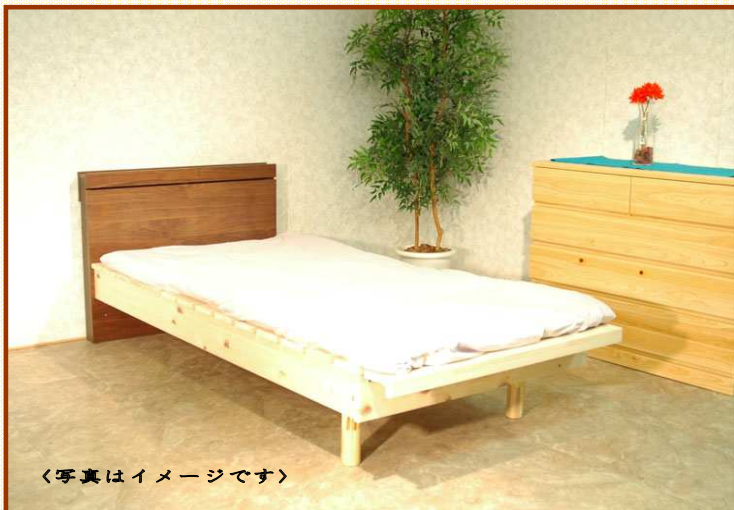
〈写真はイメージです〉