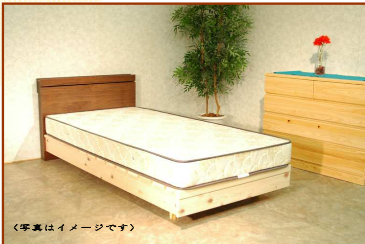
〈写真はイメージです〉