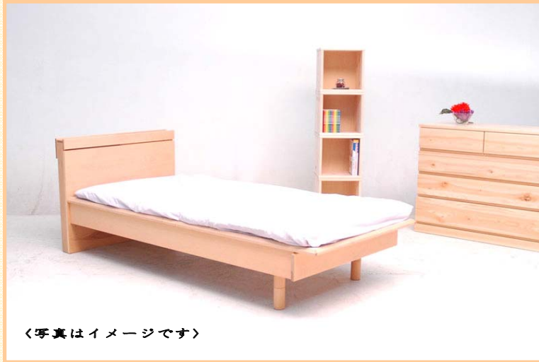
〈写真はイメージです〉