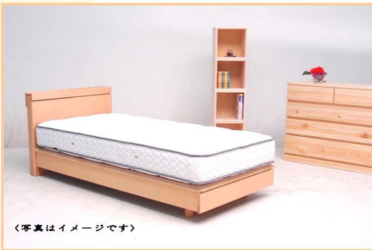
〈写真はイメージです〉